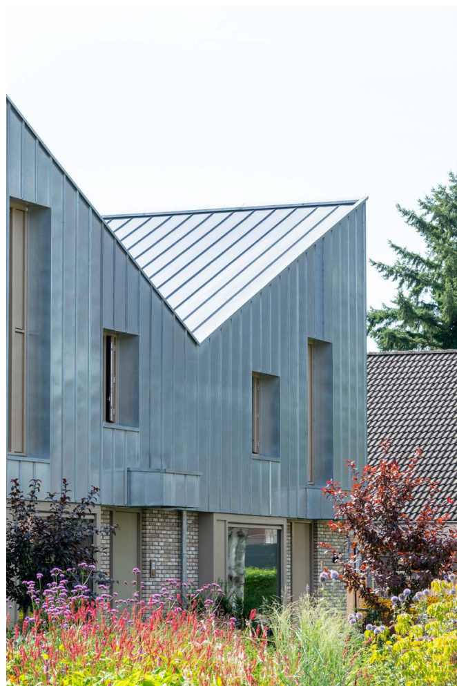
afbeelding 5. Verbijzondering aan het einde.