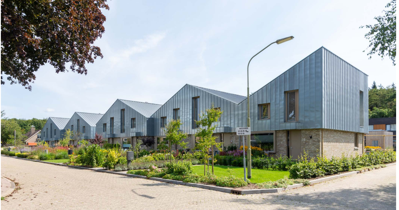
afbeelding 2. Uitgesproken kapvorm draagt bij aan de parcellering.

De volumes worden geparcelleerd door een aantal schakelde zinken kappen. Deze kappen spelen een spel met de schaal van de volumes en gaan een relatie aan met de naast gelegen villa buurt. Ook de bergingen en carports zijn samengevoegd tot één volume als duidelijke begrenzing van het openbare gebied en genereren veel privacy in de tuinen. Middels deze oplossing wordt het parkeren uit het (openbare)zicht, op eigen terrein wordt opgelost.