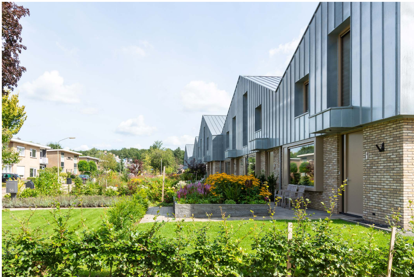
afbeelding 6. Samen met de burens zijn bouwvolumes, rooilijnen en woningaantallen bepaald.