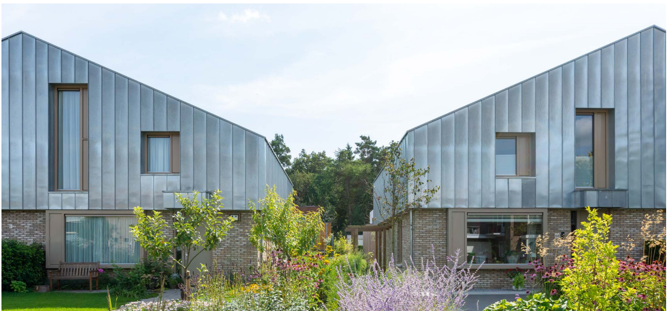
afbeelding 3. Uitgesproken kapvorm draagt bij aan de parcellering.

De duurzaamheid van de woningen ligt hem vooral in het gebruik van duurzame, natuurlijke materialen en het programma. Robuuste materialen als baksteen, onbehandeld hout en met name zink met een levensduur van min. 100 jaar geven de woningen toekomstwaarde. Ook het eerdergenoemde gemengde programma van een levensloopbestendige, gelijkvloerse indeling tot een eengezinswoning met volledig ingedeelde eerste verdieping zorgen ervoor dat de bewoners aan de Hagedoorn op een duurzame wijze, levensloopbestendig kunnen wonen.