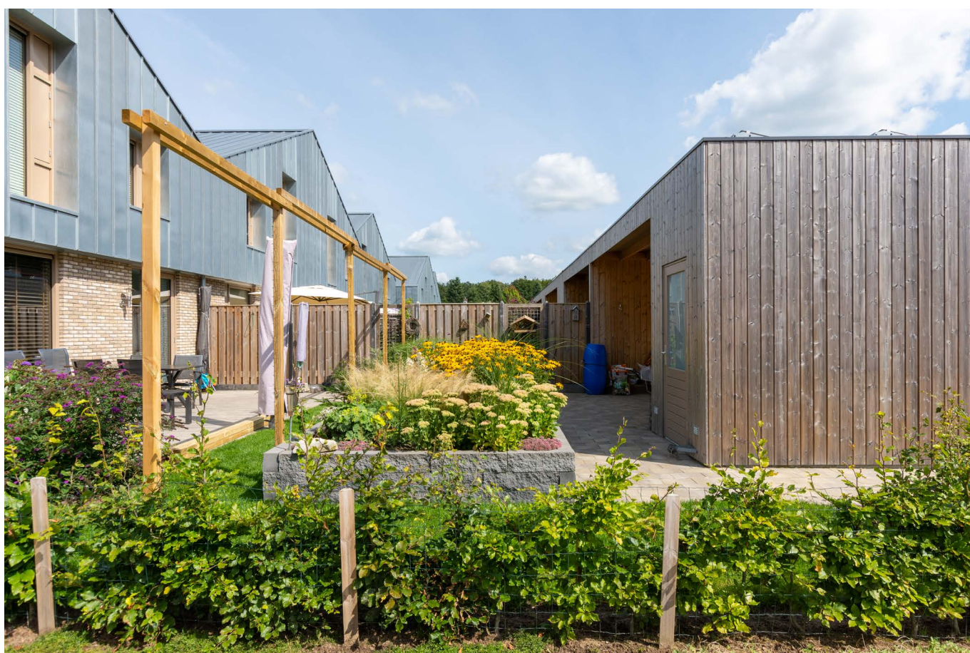
afbeelding 7. Geïntegreerde oplossing voor bergingen en parkeren.