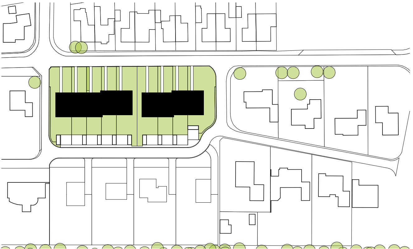
afbeelding 1. Situatie koopwoningen aan de Hagedoorn in Emmen.